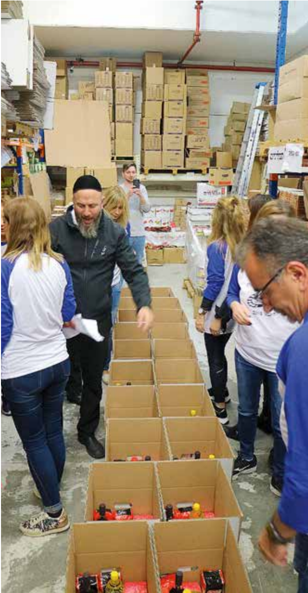
Vanligtvis levereras matpaket till 500 fattiga familjer per månad. Men till påsk och det judiska nyåret levererades särskilda matpaket till hela 8 000 hushåll.

praktiska behov och kunde ställa upp med stöd, råd och nyttig information. Centret har också haft aktiva Facebook-sidor för att informera grannskapet om alla virtuella erbjudanden; bland annat intressanta videor med sånger och danser som familjerna kan öva på hemma. Programmet har också levererat material för konsthantverk till varje familj som ett läromässigt och terapeutiskt utlopp under denna långa karantän.