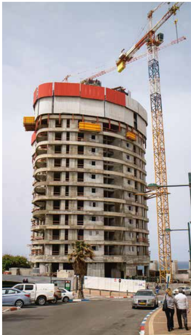
I Israel byggs landet med kunskap, forskning, kultur, innovationer och ett aktivt näringsliv. Nybyggnationen på bilden sker efter strandlinjen i Natanya.

Mycket har hänt på 70 år och det är omöjligt att beskriva detta särskilt detaljerat i en krönika. Men två stora mirakel måste vi minnas. Dels att Israel överhuvudtaget kunde utropas 1948, med