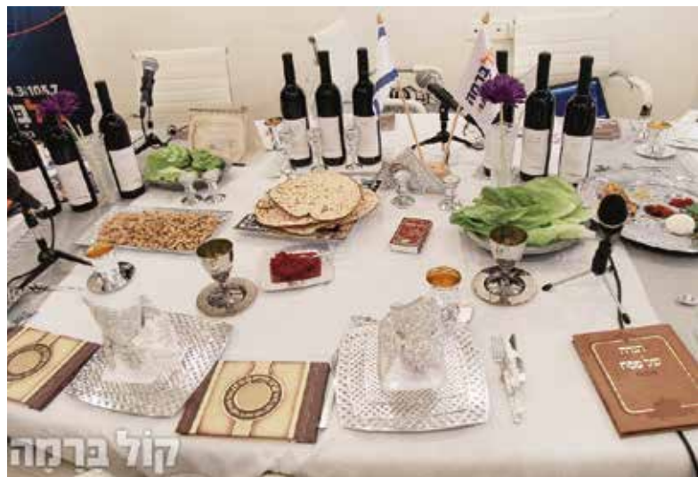
Ett dukat sederbord

Det är inte alltid lätt att veta vilka av dagens pesachtraditioner som existerade redan på Andra templets tid och vilka som tillkommit senare. I dagens påskmåltid brukar man ta tre osyrade bröd, מצות matsot, och så bryta det mittersta och lägga den delen i ett linkläde. Denna del av det osyrade brödet kallas afikoman. Ordet afikoman är grekiska och betyder ”han som kommer”. Om det är så att denna tradition med afikomanen fanns redan på Jesus tid, så var det just afikomanen Jesus tog när han sade: Detta är min kropp som blir utgiven för er. Gör detta för att minnas mig. (1 Kor 11:24)